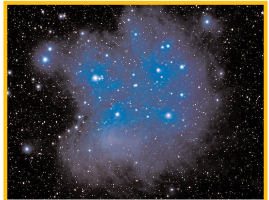
Figura 1. Las Pléyades. El difuminado azul representa la luz de las estrellas del cúmulo reflejada por el remanente gaseoso de la formación estelar.

purgadas en este espacio. De tal forma que los diagramas de movimientos propios y color-magnitud de la muestra final de probables miembros, se presentan en los paneles c y e. Finalmente, en el panel f se muestra la distribución las distancias en parsecs (obtenidas como la inversa de la paralaje en segundos de arco). El valor central de la distribución definido por la moda y la media coinciden en 136 pc con una desviación estándar de 6 pc.